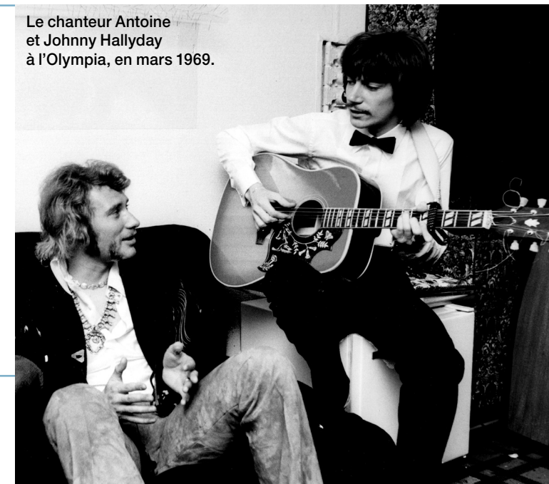
Le chanteur Antoine et Johnny Hallyday à l'Olympia, en mars 1969.