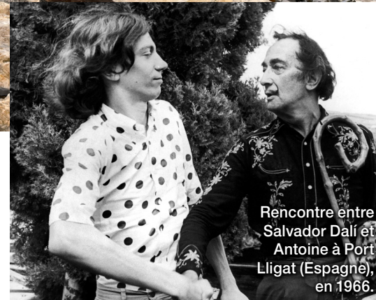
Rencontre entre Salvador Dalí et Antoine à Port Lligat (Espagne), en 1966.